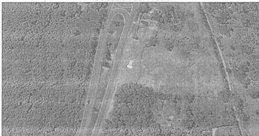
Figura 1. Ubicación del predio donde se construirá una EDS.

OBSERVACIONES DE CAMPO: Se practica visita de inspección al predio cuyas coordenadas geográficas se identificaron como N 10° 53' 2,78" – W 74° 53' 24,6", colindante como el predio denominado como "Solar de Mao", y en la cual se observaron los siguientes hechos de interés: